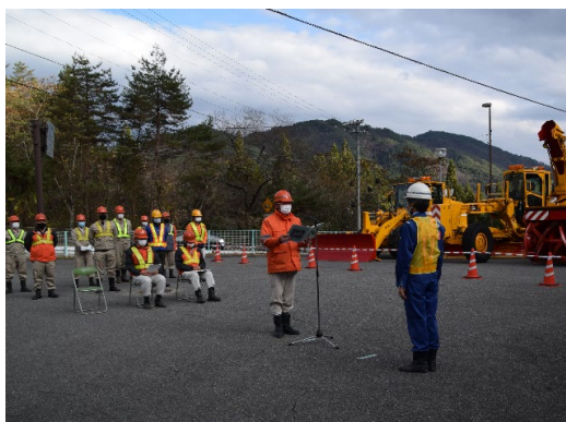
除雪作業の無事故を誓う「安全宣言」