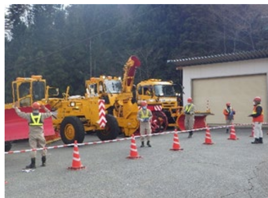
除雪機械の「安全確認」