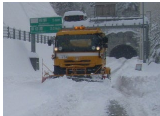
除雪トラックによる除雪作業