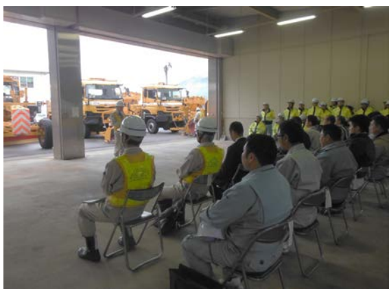
主催者（飯田国道事務所）あいさつ