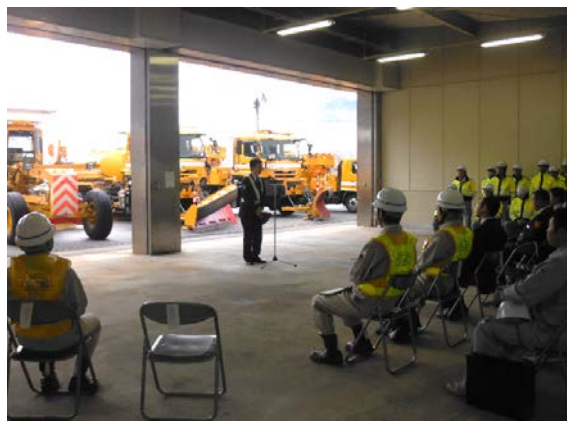
来賓（木曾警察署）あいさつ