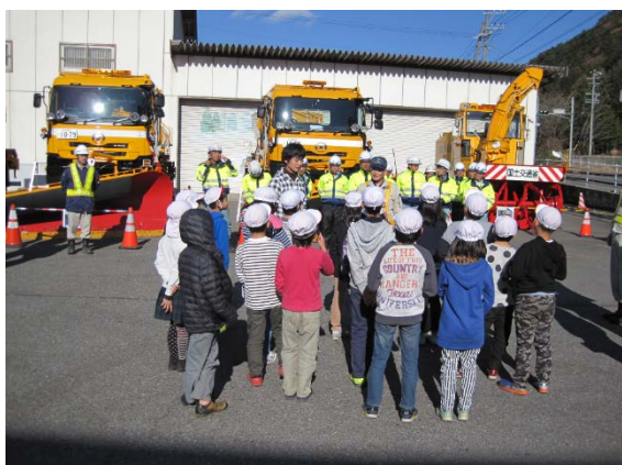
除雪機械・施設の見学