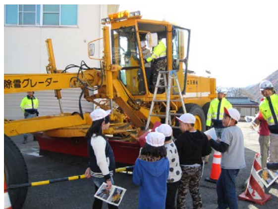
除雪機械乗車体験