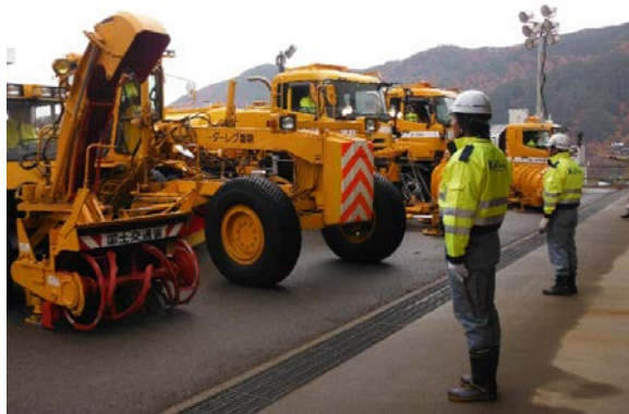
除雪機械の安全点検