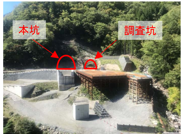
長野側坑口(全景)(H30.12撮影)