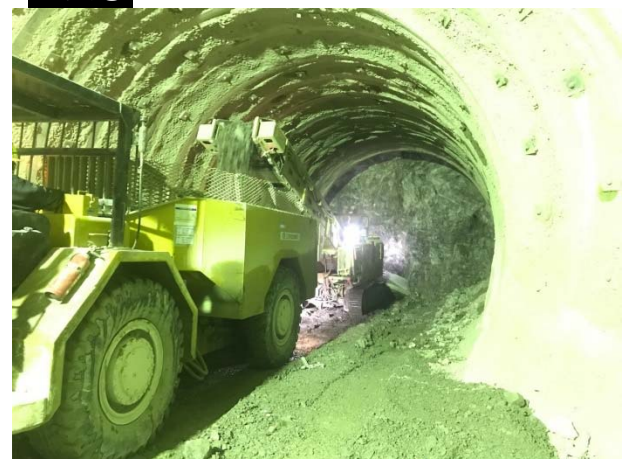
静岡側調査坑内(H30.12撮影)