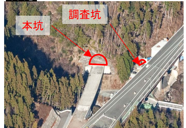
静岡側坑口(全景)(H30.12撮影)