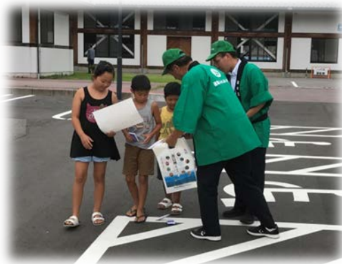
(去年の活動の様子)