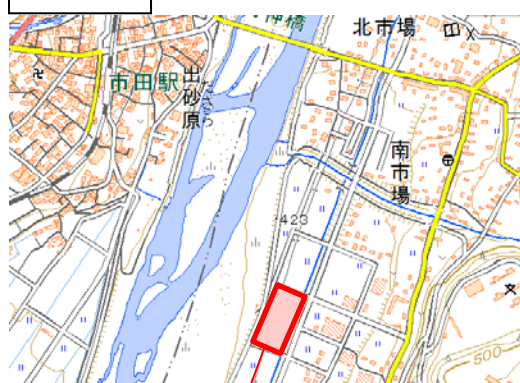
道の駅 南信州とよおかマルシェ