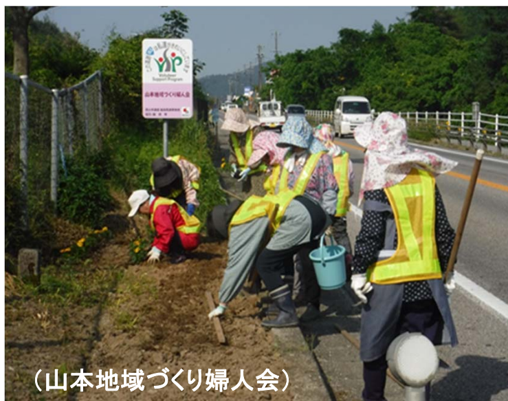
(山本地域づくり婦人会)