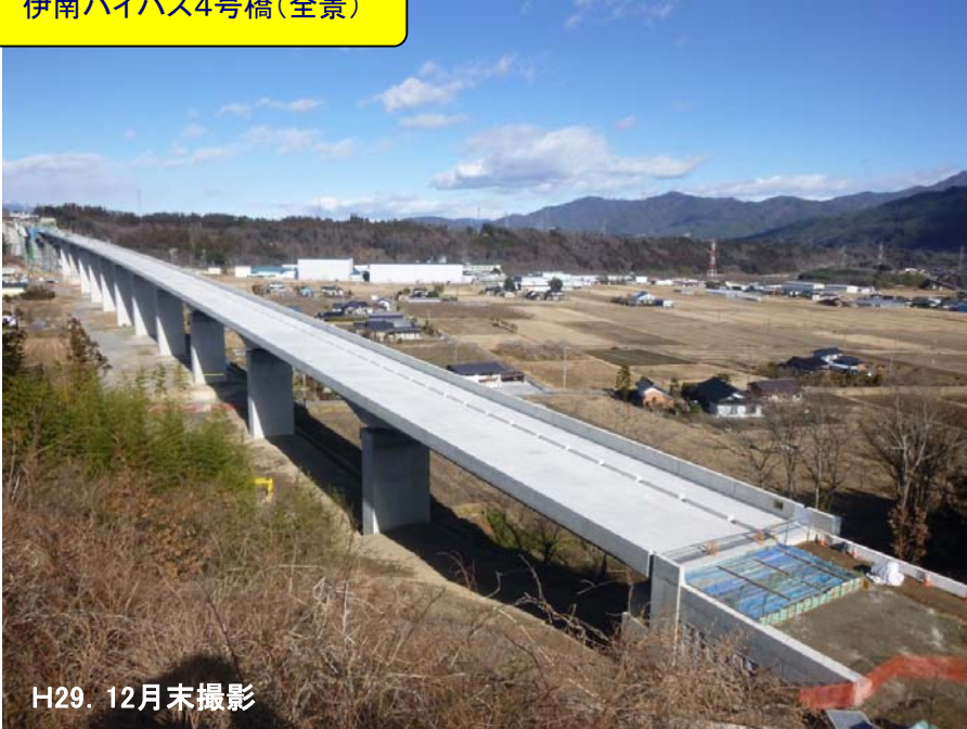
伊南バイパス4号橋(全景)