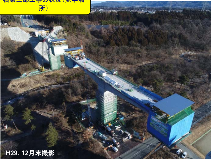
橋梁上部工事の状況(見学場所)