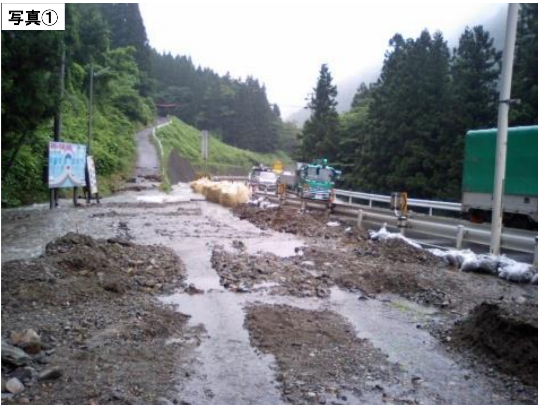
写真① H18.7 大出水・冠水/土石流発生 約4時間全面通行止め