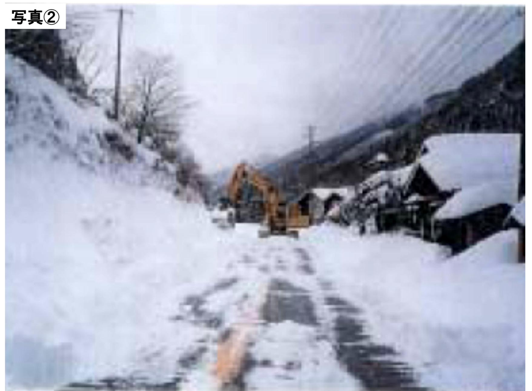
写真② H10.1 大雪による雪崩発生 約31時間全面通行止め