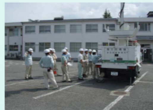
照明車の操作訓練