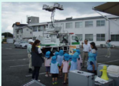
「飯田子供の園」保育園児 の皆様