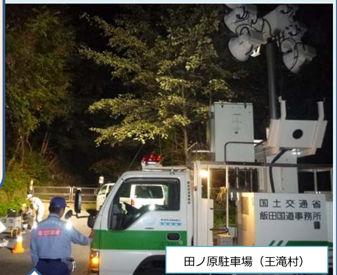
田ノ原駐車場 (王滝村)

王滝村から要請を受けKu-Sat (本局) と照明車による監視活動への支援 (飯田照明車9/29~10/5)