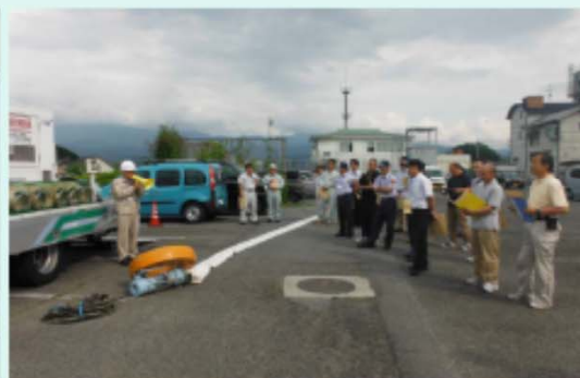
下伊那郡町村会職員・下伊那郡土 木技術センター組合・飯田広域消防 の皆様