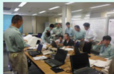
ホームページアップ等 パソコン操作訓練