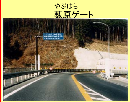
やぶはら 藪原ゲート