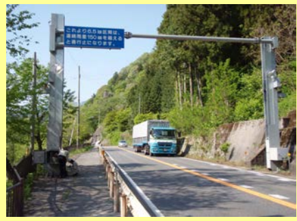
きびゆう 黍生ゲート(多治見砂防国道事務所)