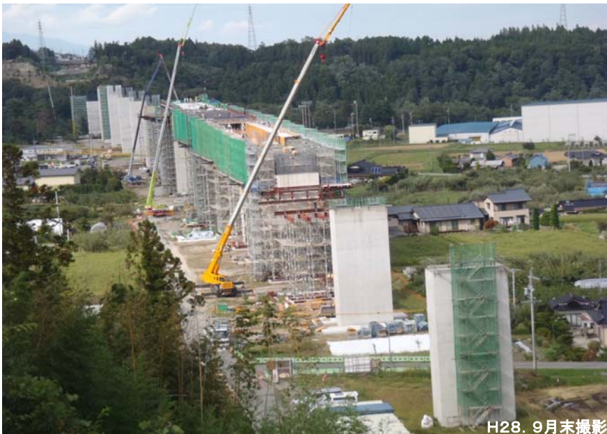
H28. 9月末撮影 伊南バイパス4号橋: 全長990m(橋梁の高さ: 地上より最大約44m)