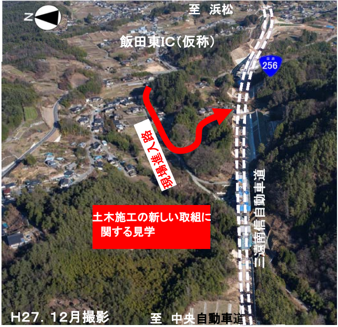
三遠南信自動車道(工事中) (飯田東IC(仮称)付近)