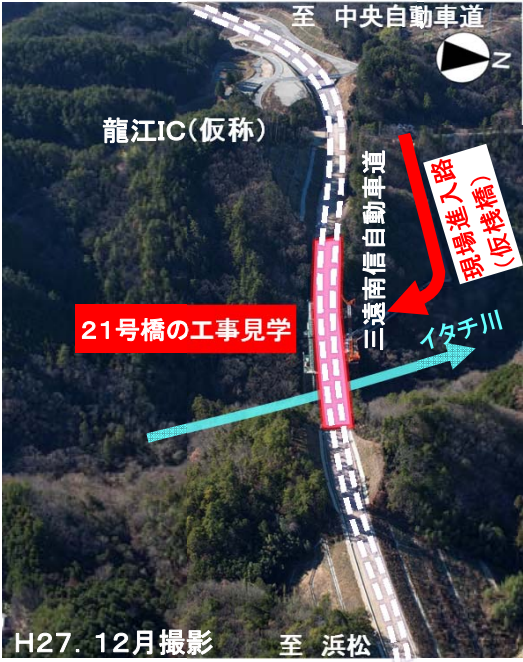
三遠南信自動車道(工事中) (龍江IC(仮称)付近)