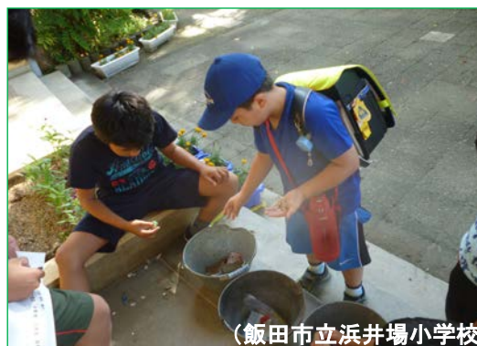
(飯田市立浜井場小学校)