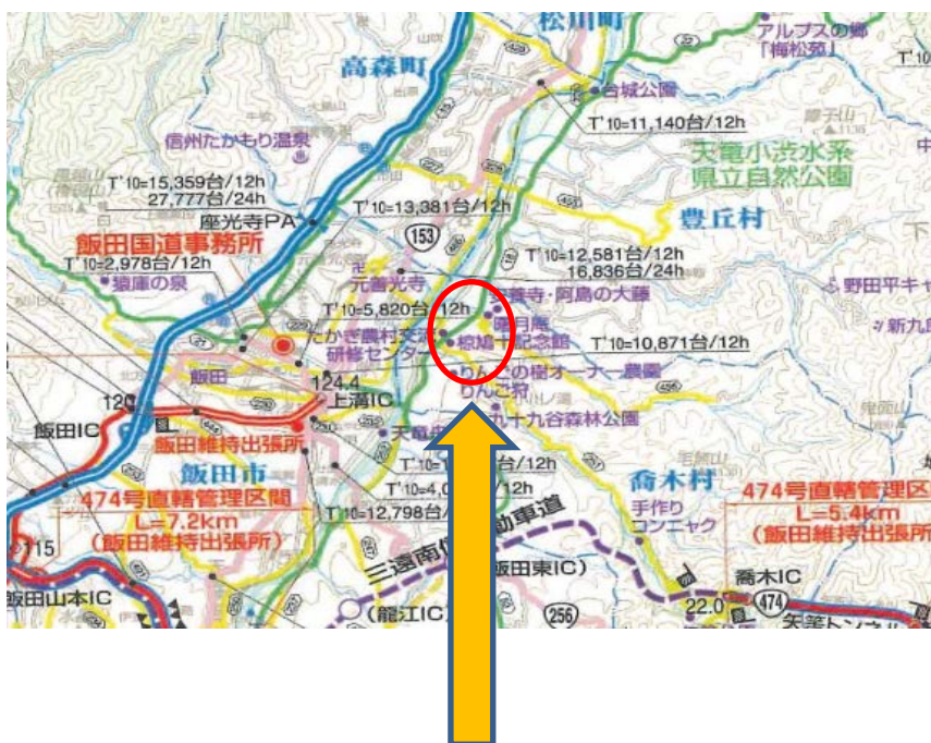
活動場所：村内の通学路