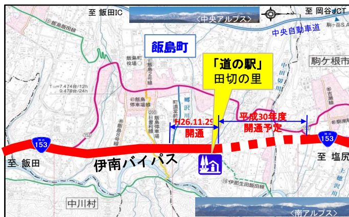
【「道の駅」田切の里位置図】