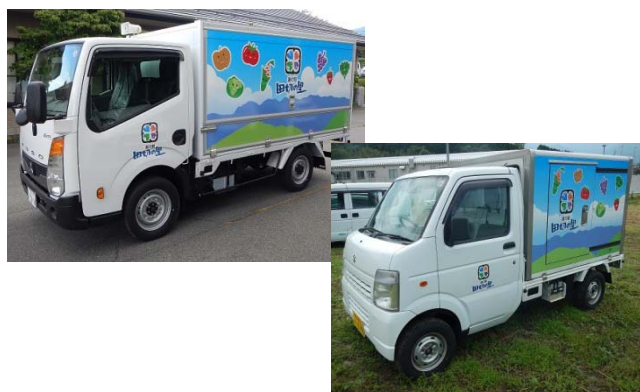
【移動販売車・宅配サービス車】