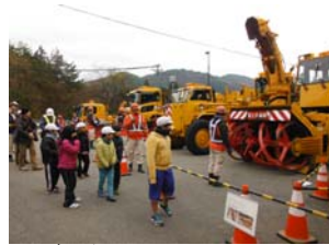
せいらいじ 清内路小学校児童の見学