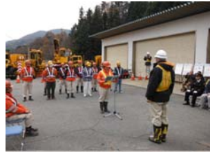
請負業者安全宣言