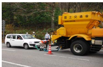
放置車両に牽引ロープをかける