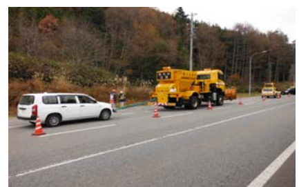
凍結防止剤散布車で牽引