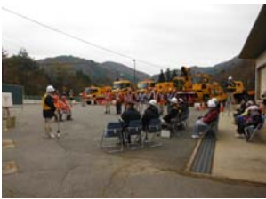
事務所長あいさつ