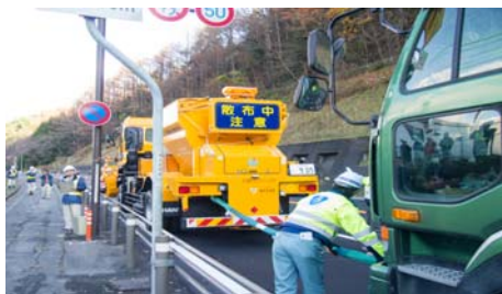
放置車両に牽引ロープをかける