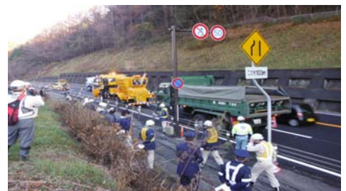
凍結防止剤散布車で牽引