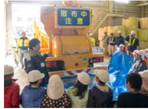
ひよし 白義小学校児童の見学