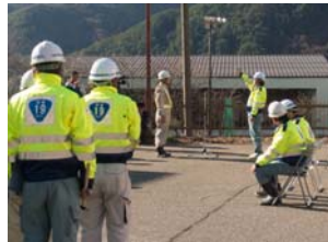
請負業者安全宣言