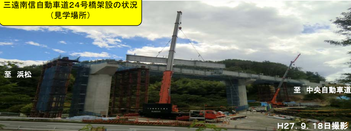
三遠南信自動車道24号橋架設の状況 (見学場所)