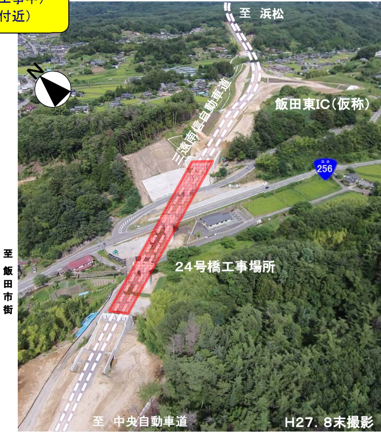
三遠南信自動車道(工事中) (飯田東IC(仮称)付近)