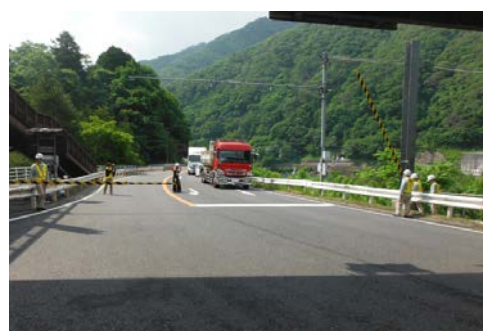
ゲート操作は隣接する多治見砂防国道事務所と連携して実施します。