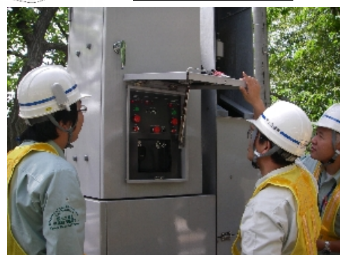
遮断機操作の様子