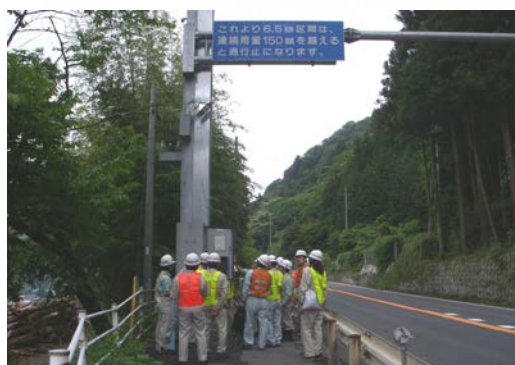
遮断機操作訓練の様子