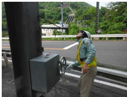
遮断機は車道の両側についており、ゲートを下ろし通行規制訓練(一時通行止)を行います