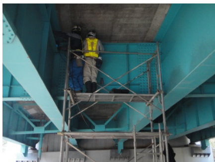
足場を利用した点検事例 （講習会での昇降は階段式とします）