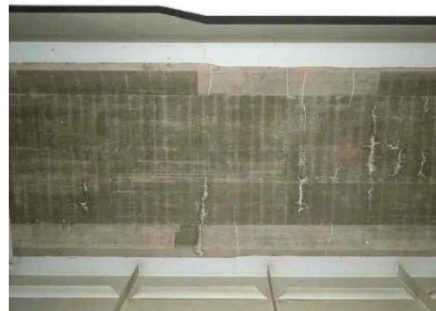
床版ひび割れ状況（床版下面）