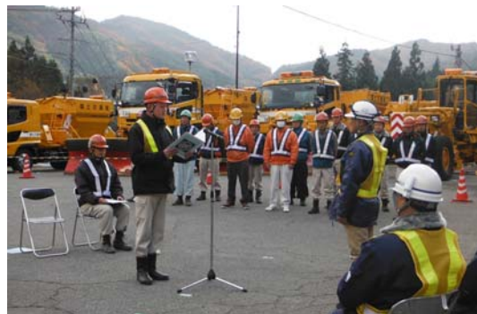
請負業者安全宣言