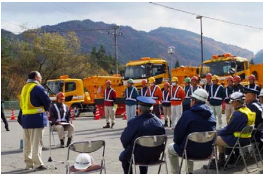
事務所長あいさつ