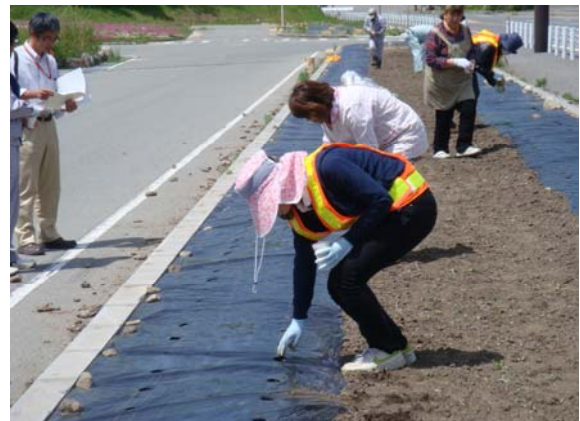
過去のひまわり種蒔きの様子です。