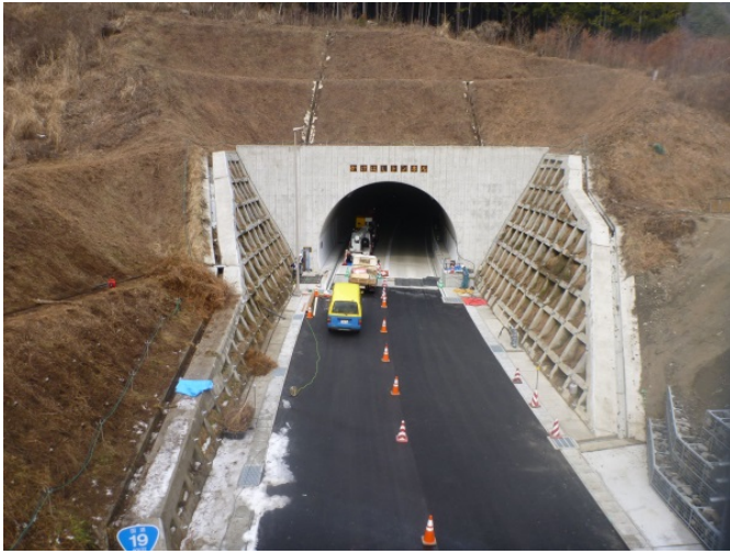
かけはしトンネル