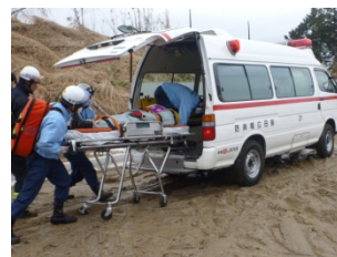
④被災者の搬送訓練