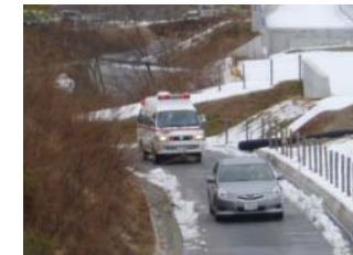
②緊急車両の誘導訓練