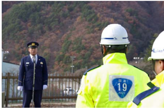
木曾警察署長 来賓挨拶