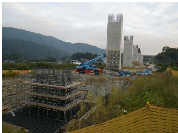
4号橋下部工事 9月末撮影