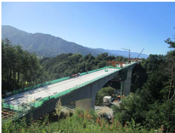
2号橋PC上部工事 9月末撮影