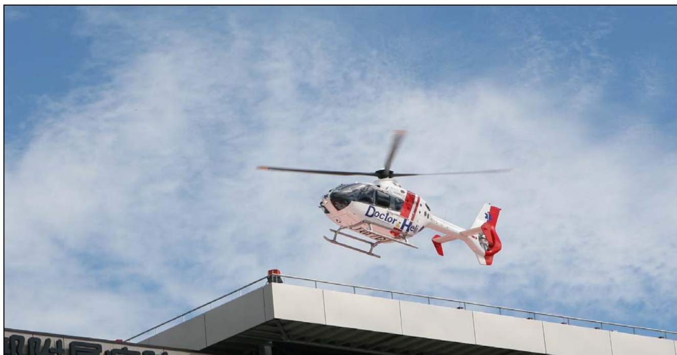
H23年11月10日 矢筈トンネル防災訓練実施時の写真