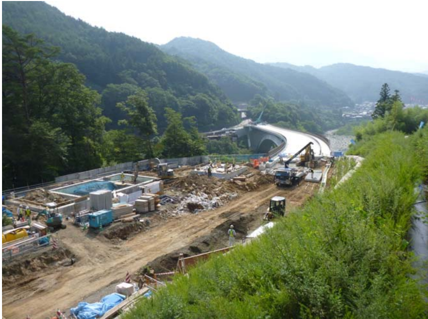
写真1 長大コンクリート橋および土工部写真