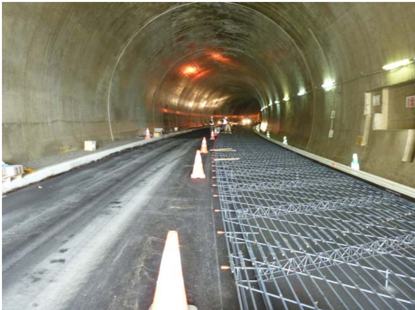
写真2 トンネル内写真