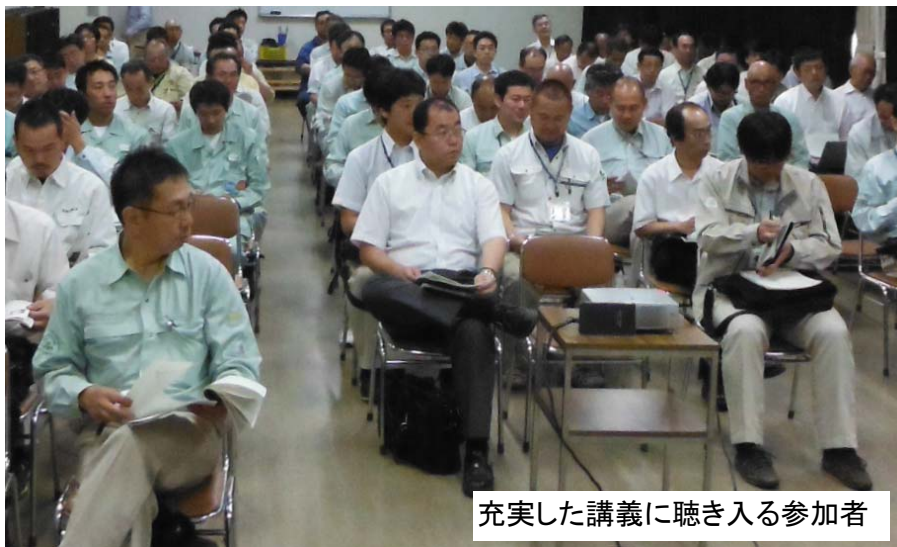
充実した講義に聴き入る参加者