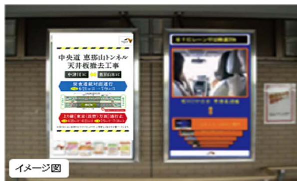
マルチインフォメーションボード