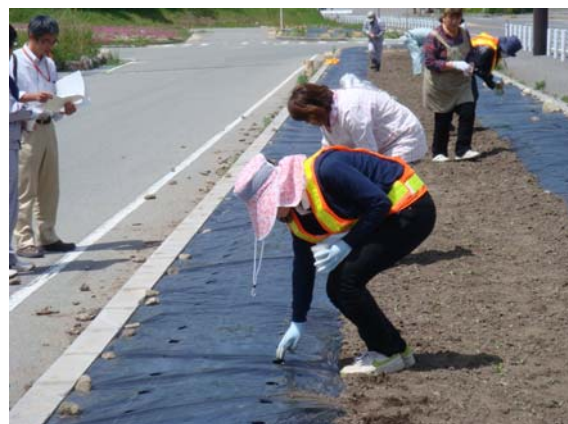
去年のひまわり種蒔きの様子です。