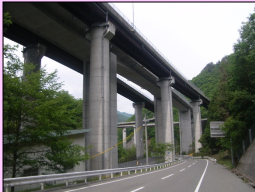
■ 飯田市側からランプを望む