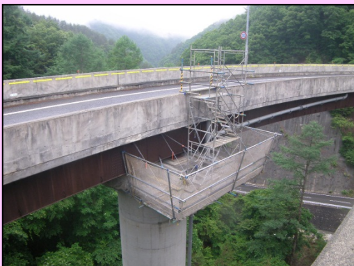
■全12径間 鋼非合成鉄桁・箱桁L=361m ■引き続き、落橋防止工を実施