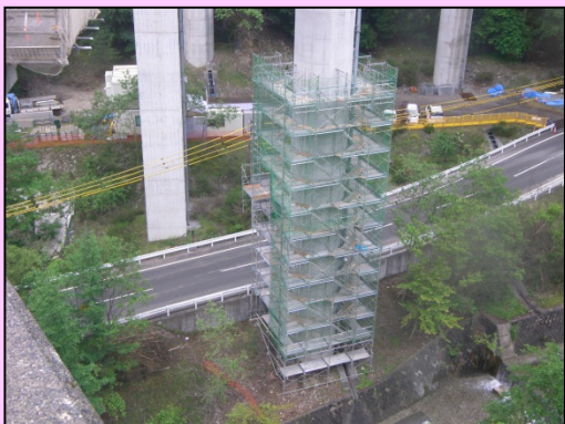
■全8径間 鋼非合成鉄桁・箱桁L=264m ■引き続き、炭素繊維巻き立て補強を実施