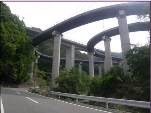
■ 喬木村側からランプを望む