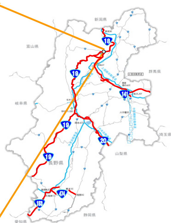
▲長野県内のモデル地区(長野市居町地区)