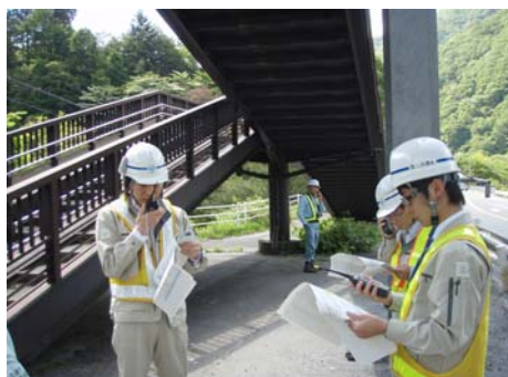
多治見砂防国道事務所との情報連絡訓練の様子