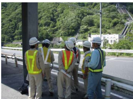
遮断機操作訓練の様子