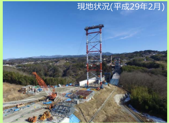
現地状況(平成29年2月)