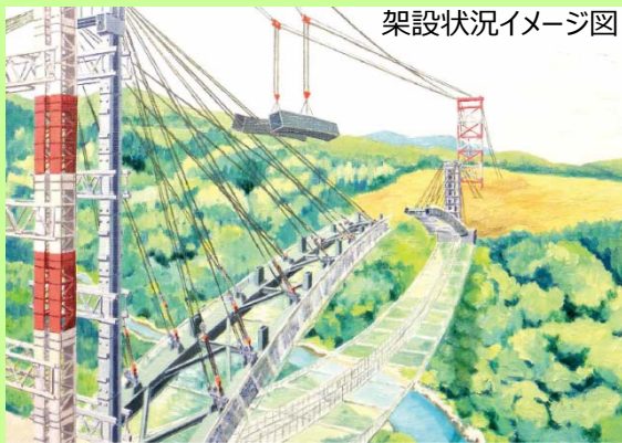
架設状況イメージ図