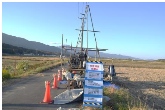
▲ 地質調査作業イメージ