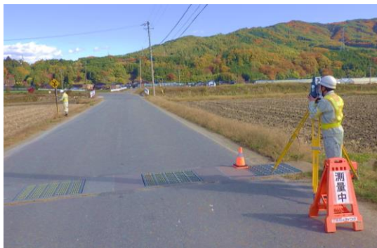
▲ 測量作業イメージ