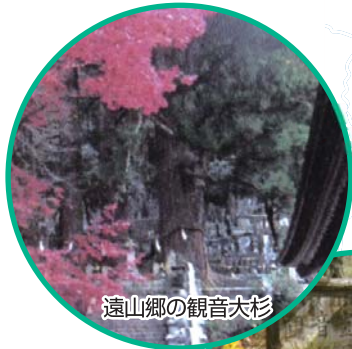
遠山郷の観音大杉