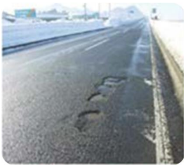
路面の穴ぼこ・ 段差