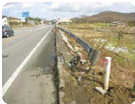
ガードレール・ 標識等の損傷