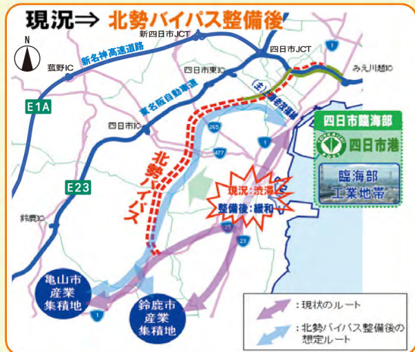
[四日市臨海部⇄産業集積地の所要時間]

北勢バイパスの整備により、円滑な物流の確保による効率化や産業間連携を促進するなど、地域経済の活性化を支援します。