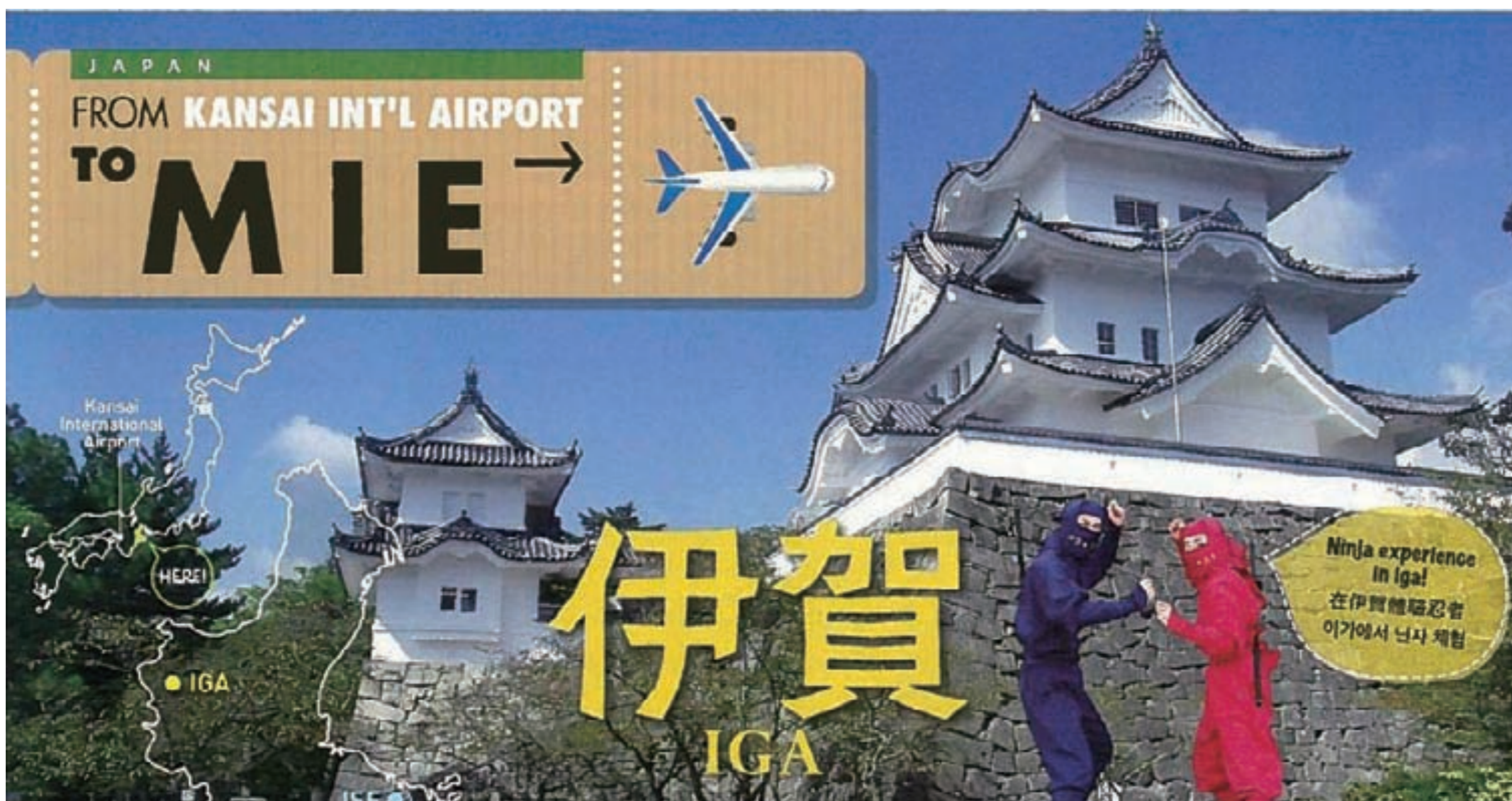
マレーシアの旅行会社のツアー広告