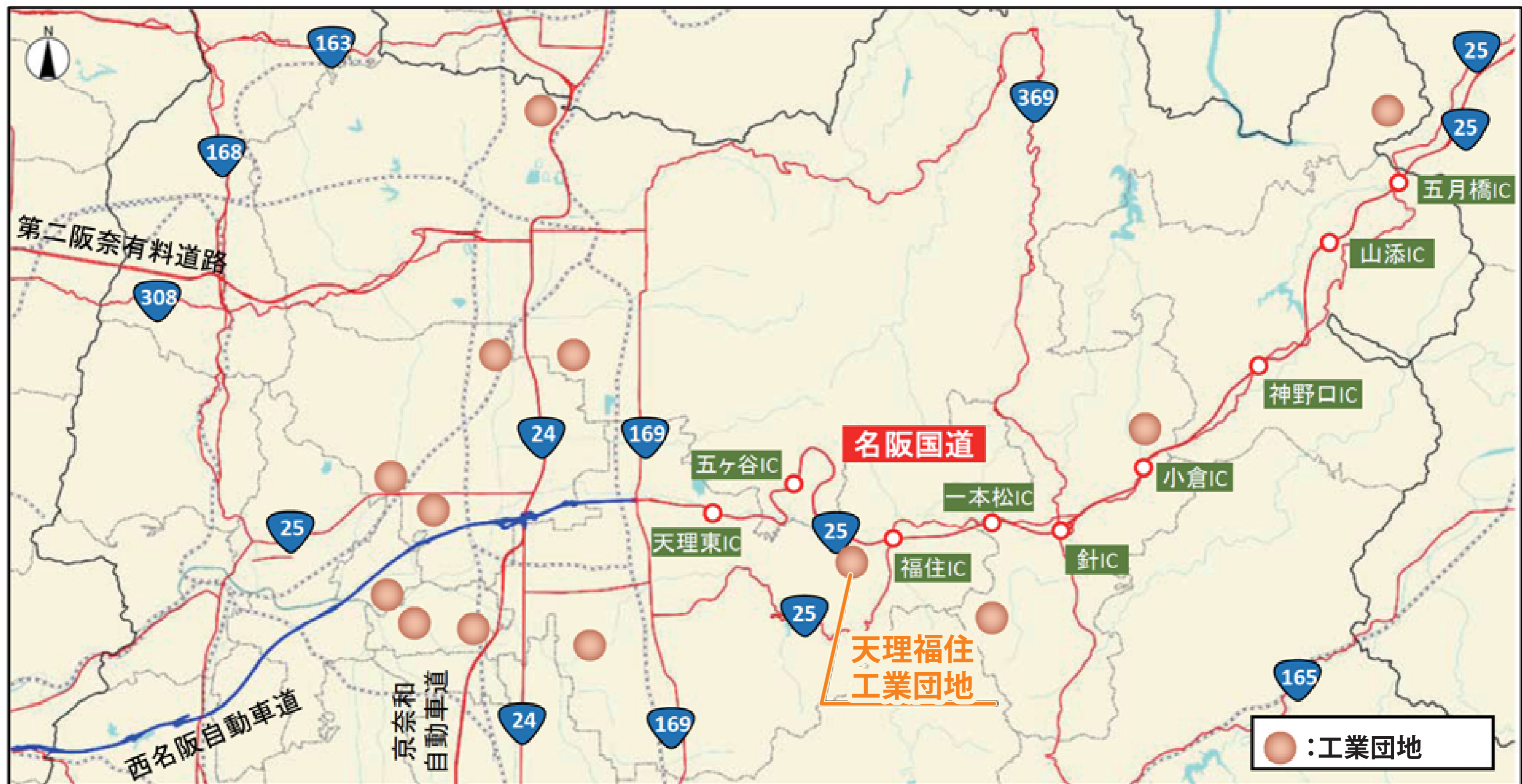
【天理福住工業団地周辺の変化】