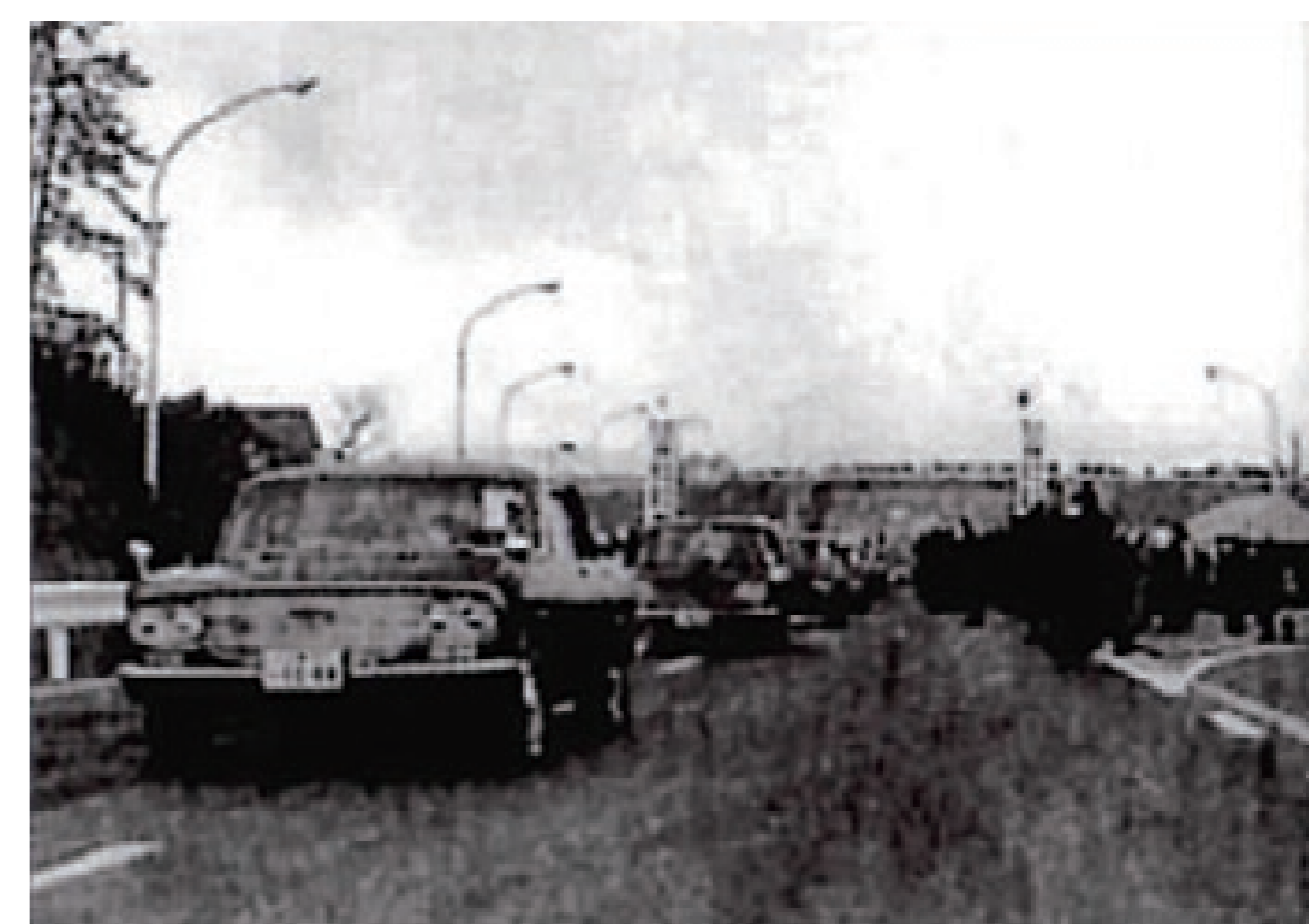
名阪国道一期工事完成