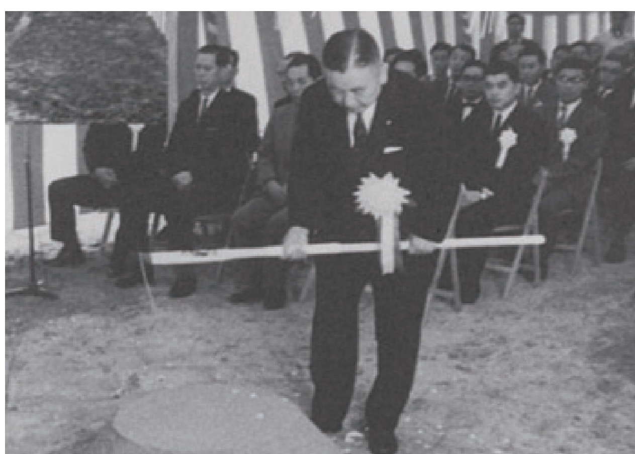
河野一郎建設大臣による鍬入れ

片側一車線の道路として、第一期工事は亀山～天理間を結んだ。 これはあくまでもスタート地点にすぎず、 これから四車線化に向けての次なる事業が始まる。