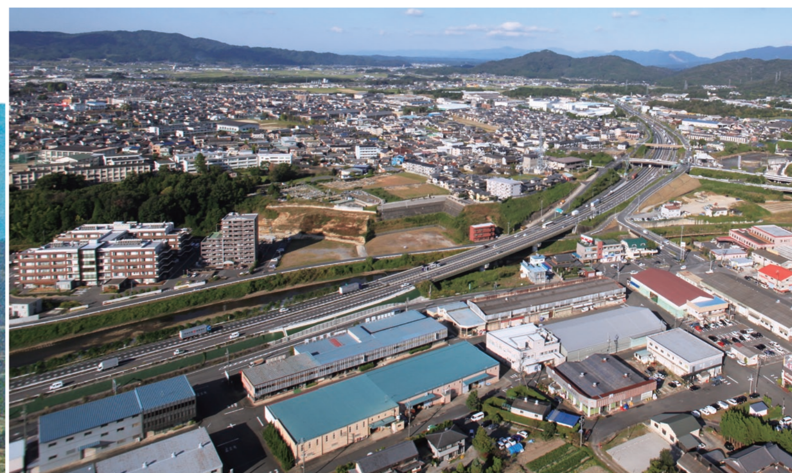
▲友生IC周辺を東向きに望む (2015)