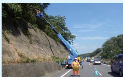
舗装、区画線の補修や樹木の伐採を実施します。