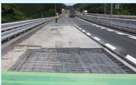
橋梁の舗装下のコンクリートを補修します。