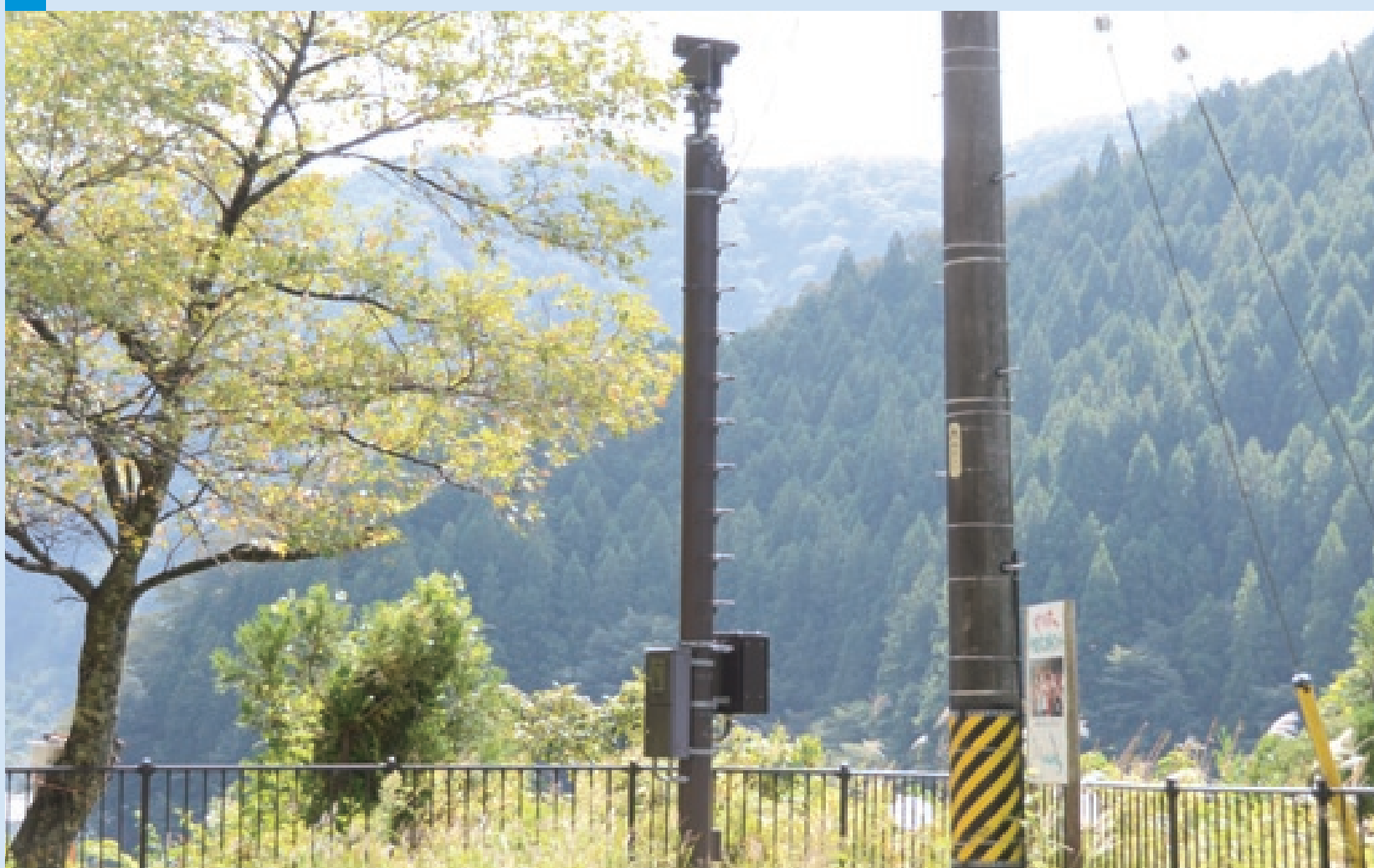
映像により異常 いじょう がないか確認するための設備。