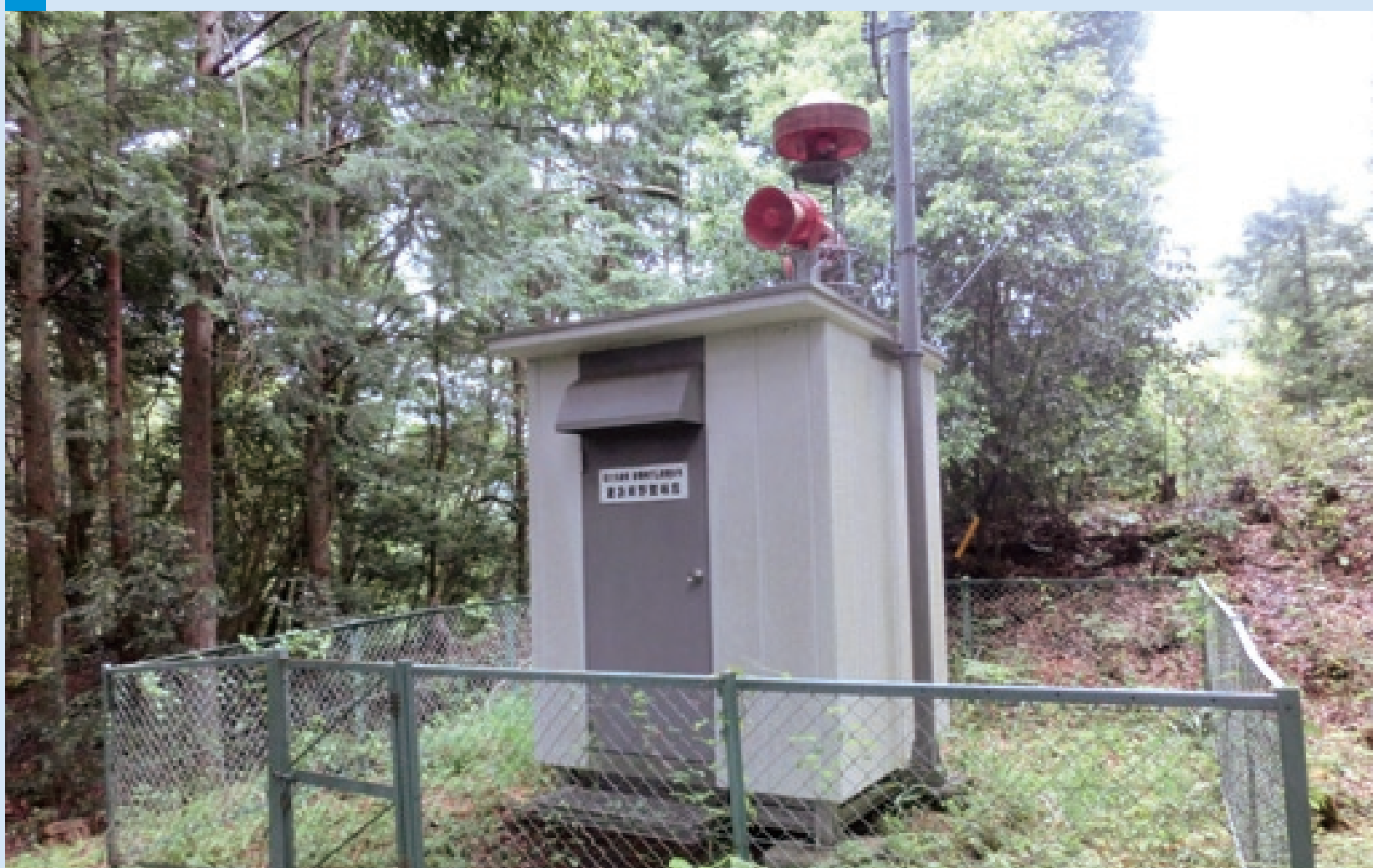
放流を行う際にサイレンにより河川利用者 しゅうち へ周知するための施設。