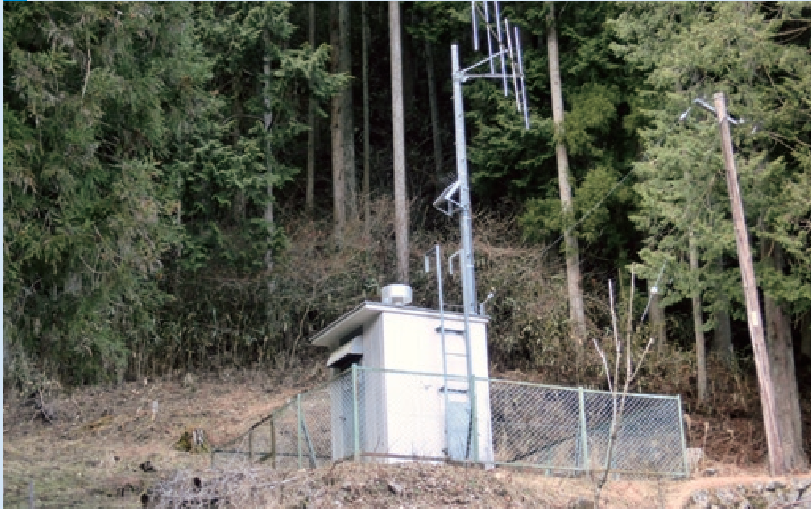
ダムの上流域に降る雨を観測する施設。