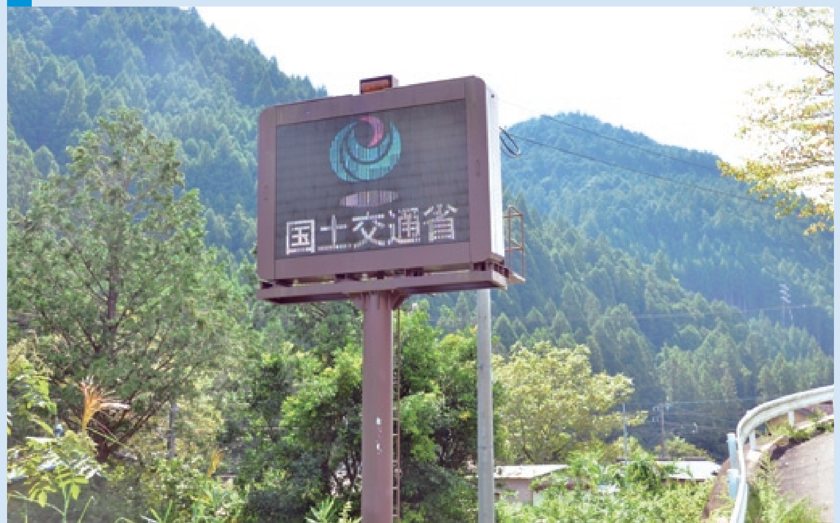
放流を行う際に電光掲示により河川利用者へ周知するための施設。