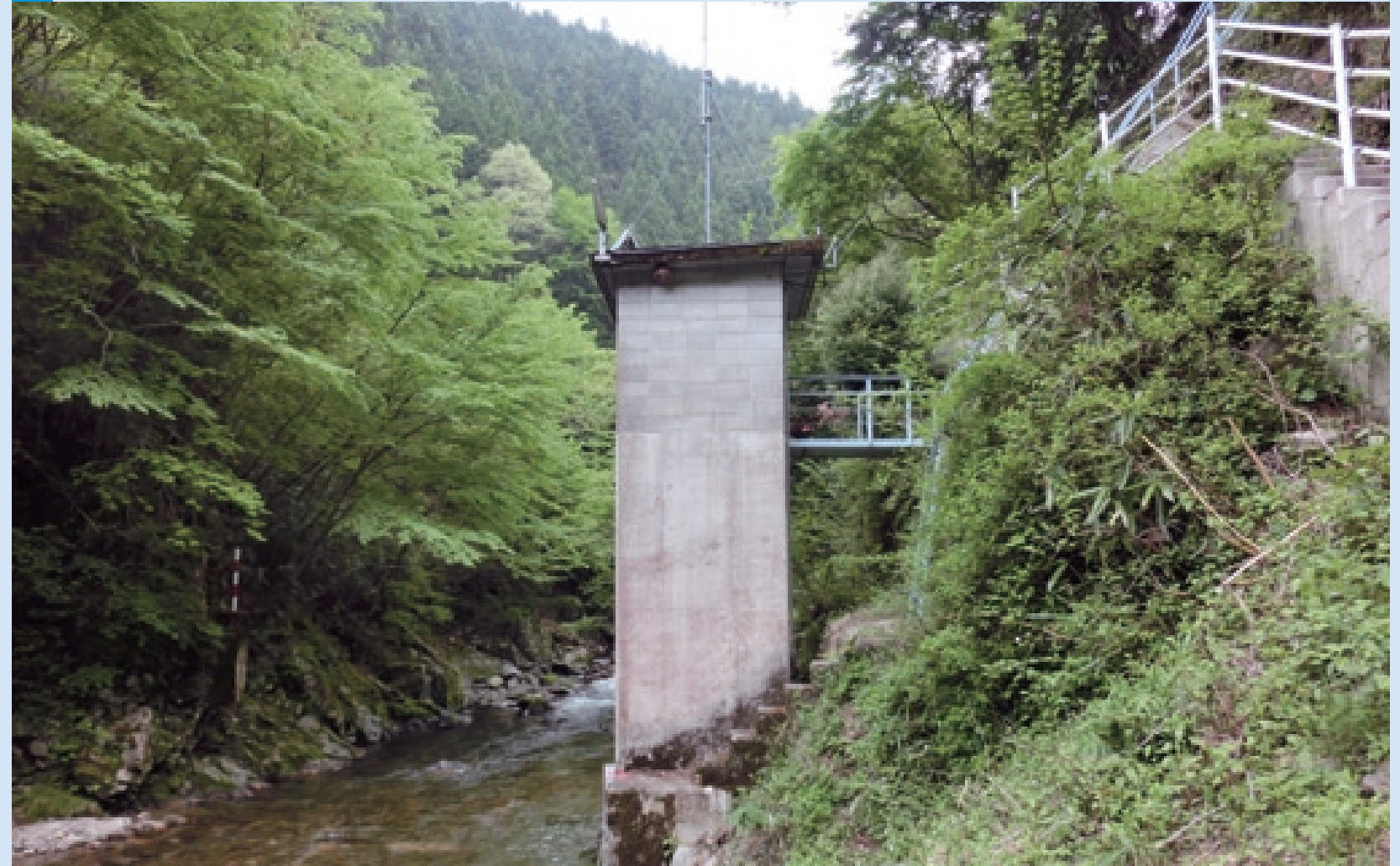
河川水位からダムへの大まかな流入量 りゅうにゅうりょう を事前に把握 はあく したり、下流河川の水の量を把握するための施設。