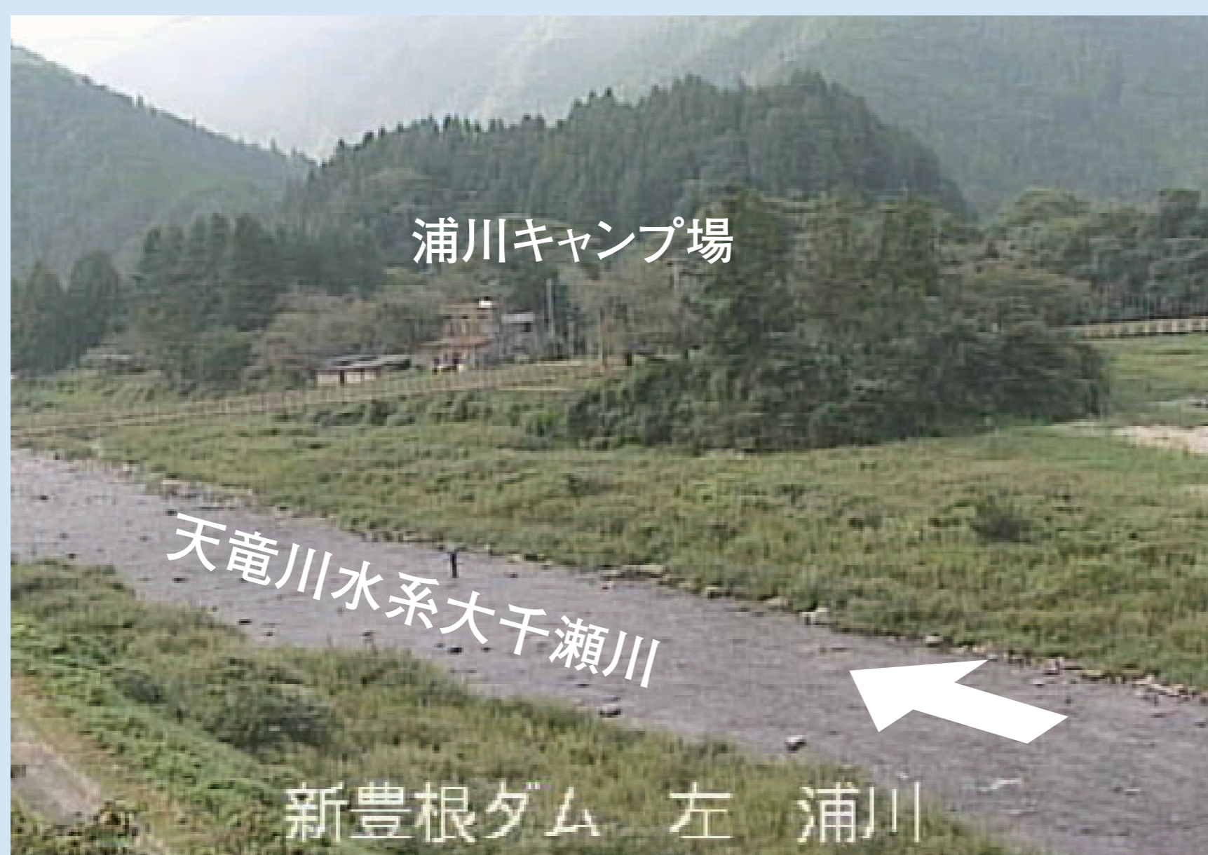
通常水位時の浦川地区 (9/14 8時26分)