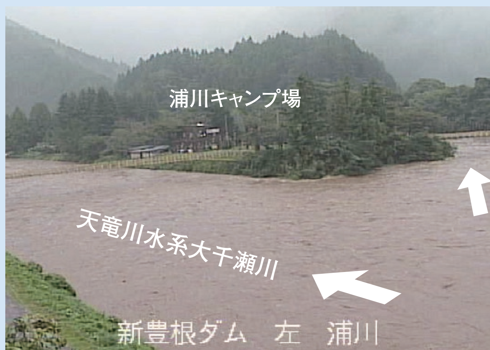
最高水位頃の浦川地区 (9/16 8時26分)