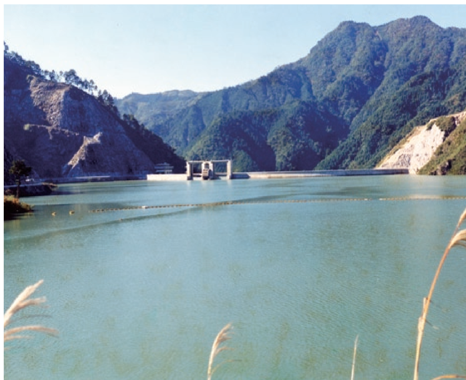
平常時最高貯水位(EL474.0)付近まで試験湛水が進んだ様子