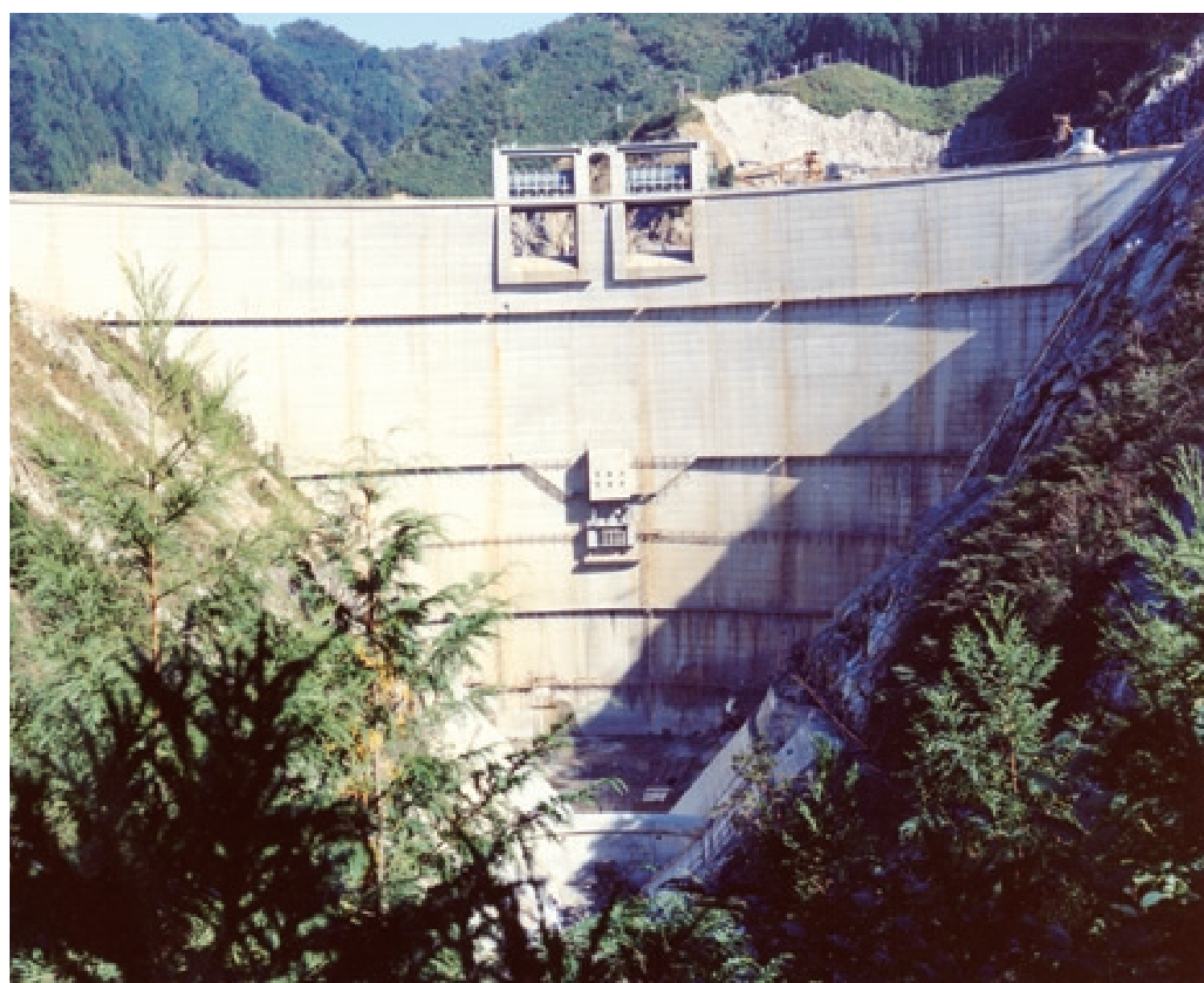
下流側から見た試験湛水中の様子