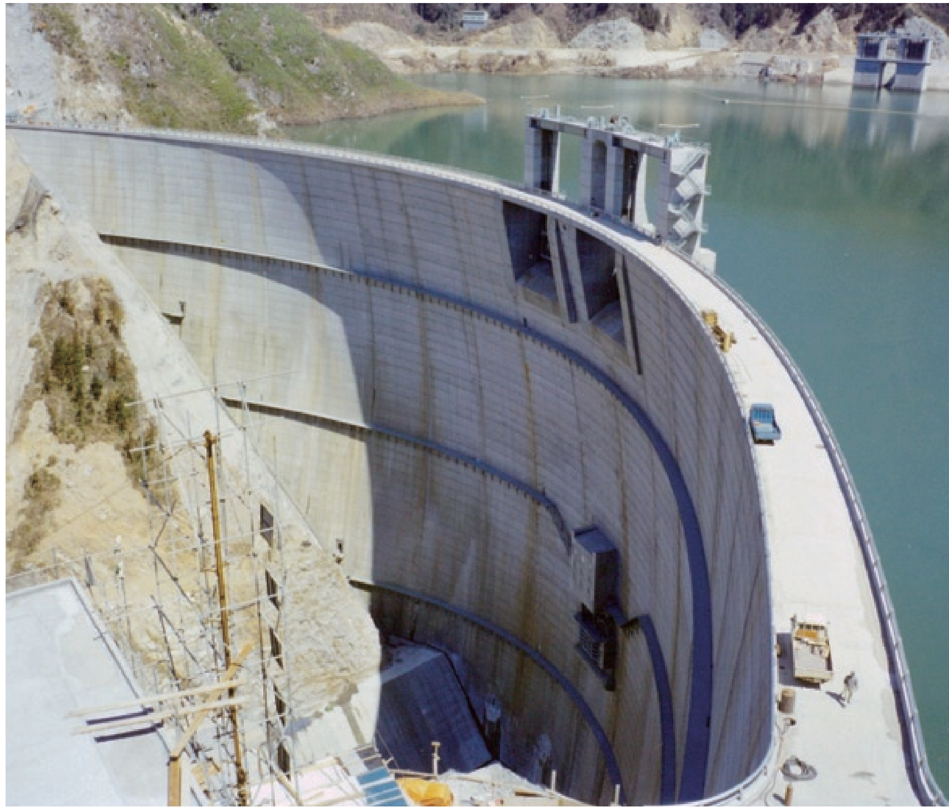
試験湛水中に附属施設の整備が進む様子