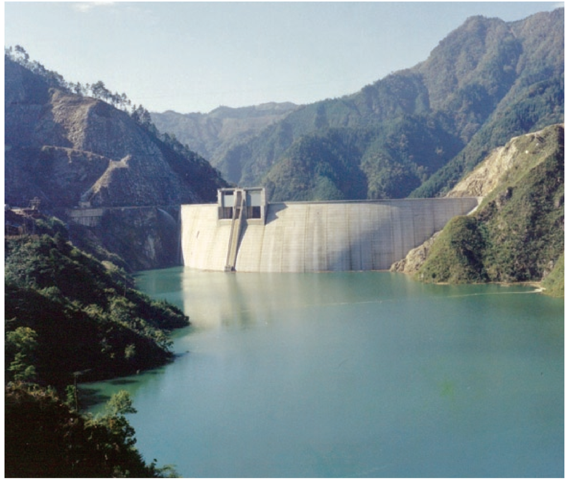
放流管中心高(EL414.5)付近まで試験湛水が進んだ様子