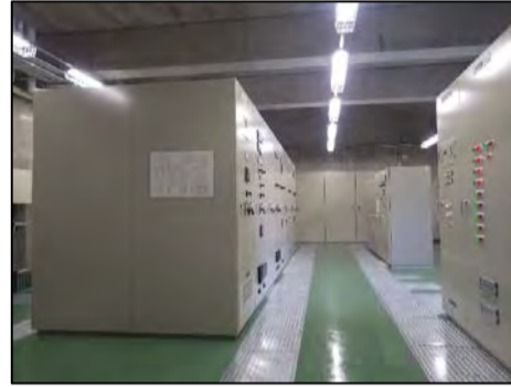
浦川・奈根トンネル