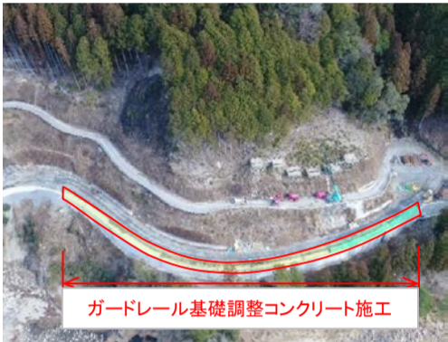
ガードレール基礎調整コンクリート施工