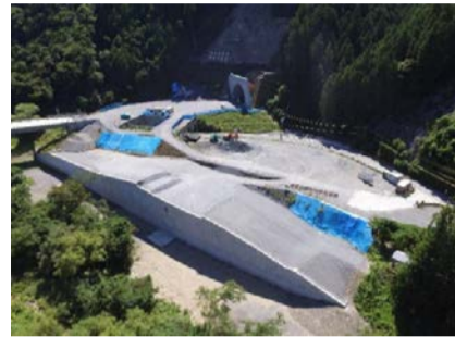
上空より現場全景

補強土壁、重力式擁壁、排水構造物等の施工を完了しました。地域の皆様には、工事にご理解・ご協力頂き、ありがとうございました。