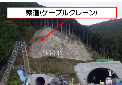
索道(ケーブルクレーン)

トンネル上部の法面詳細調査を実施し、索道を設置しました。引続き盛土を行うための土砂を大型ダンプにて搬入します。