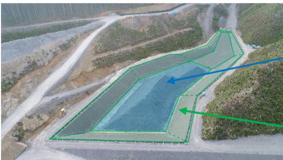
対策土受入ヤード