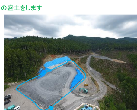
場内仮置きの様子