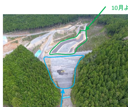
場内仮置きの様子

佐久間第2トンネル等で発生した掘削土を受入れていきます。10月より対策土の盛土の施工に入ります。