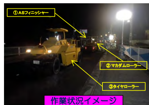
作業状況イメージ