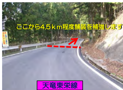
ここから4.5km程度舗装を補強します

現在、工事未着手で地域の皆様及び各所関係機関様と打合せ調整した後、工事着手します。昼間施工もありますが主に夜間工事となります。地域の皆様方には期間中、大変ご迷惑をお掛けしますが、ご理解、ご協力よろしくお願い申し上げます。