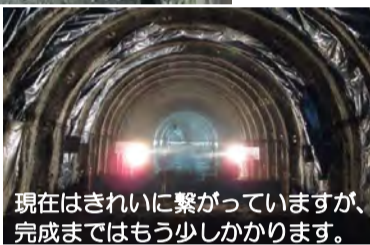
4/14 ついに避難坑が貫通！！

着々と仕上げのコンクリートに向けて作業が進んでいます。写真は、漏水防止用のシートの設置が完了した様子です。