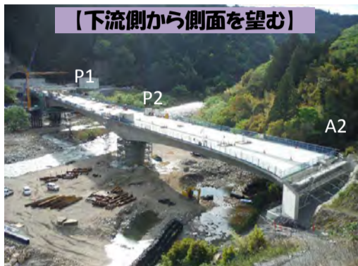
【下流側から側面を望む】

橋が繋がりました。今後は、排水等付属設備の施工を順次行っていきます。4/25時点での進捗 270.0m/270.0m