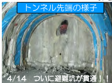
トンネル先端の様子

本坑、避難坑とも掘削完了しました。引続き、本線トンネルのコンクリートの施工を進めています。4/25現在の覆工コンクリート進捗 857.5m/1.555m