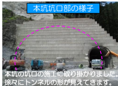
本坑坑口部の様子