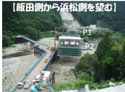
[飯田側から浜松側を望む]

これから徐々に橋が伸びていきます。6/20時点での進捗 41.0m/270.0m