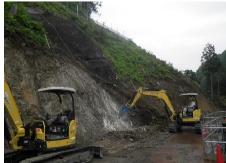
[大千瀬川右岸から左岸を望む]